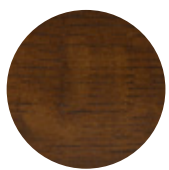
Walnut Oak Rovere Noce