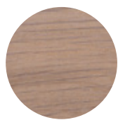
White Oak Rovere Bianco