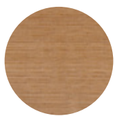
Natural Oak Rovere Naturale