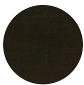
Dark Wengé Oak / Rovere Dark Wengé