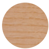
Natural Ash Frassino Naturale