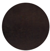
Dark Wengé Ash / Frassino Dark Wengé