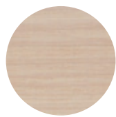
White Ash Frassino Bianco