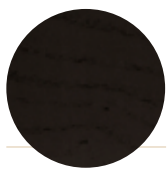
Black Ash Frassino Nero