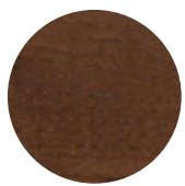
Walnut Ash Frassino Noce