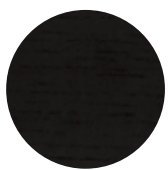
Black Oak Rovere Nero